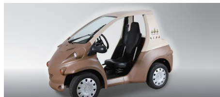
もくまる トヨタ車体株式会社