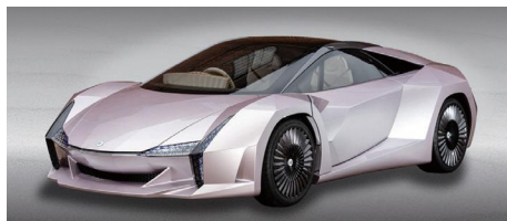
ナノセルロースヴィークル 環境省