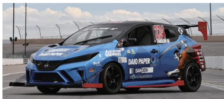
SAMURAI SPEED 大王製紙株式会社